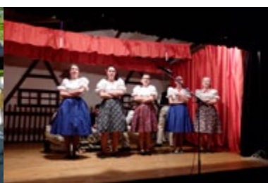
Charita nacvičila nový program.....6