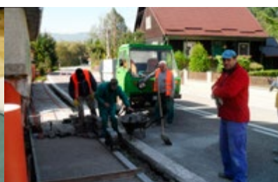
Ľudia si zaplatia za rozvoj.....3