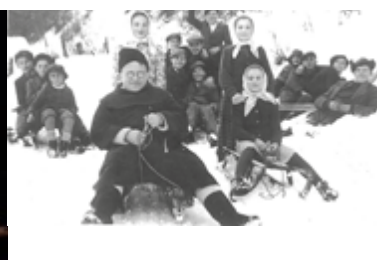
Podel'te sa o zážitky s Oteckom...7