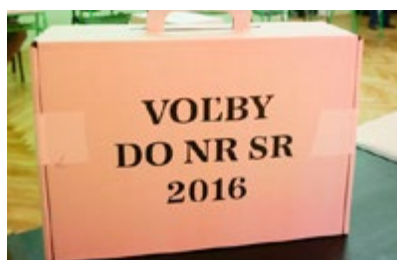
Ako hlasovali Hornolehoťania.....2